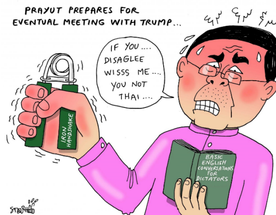
タイ首相も米国大統領対応は大変だ

本誌は不定期で発行する予定です。配信ご不要の方は、お手数をお掛けしますが、下記連絡先あてご連絡ください。