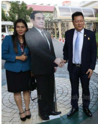
Source: Bangkok Post 9 January 2018 タイ首相の立雛が新たな人気スポット (「記者会見は彼に聞いてくれ」と首相)