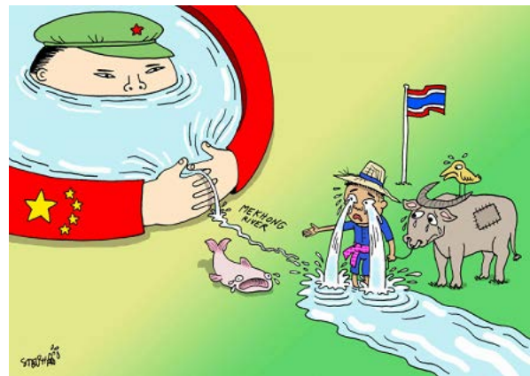
The Nation 22 July 2019

本誌は不定期で発行する予定です。配信ご不要の方は、お手数をお掛けしますが、下記連絡先あてご連絡ください。