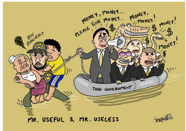
Stephffart 18 September 2019

Note: Cartoonist Stephff resigned from the Nation newspaper on 13 September 2019.