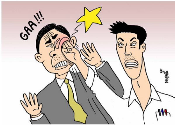
15 December 2019