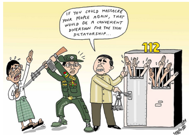
Stephffart 17th February 2021

本誌は不定期で発行する予定です。配信ご不要の方は、お手数をお掛けしますが、下記連絡先あてご連絡ください。